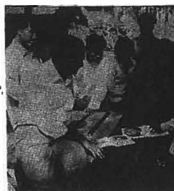
تصویر شماره ۴

مصرف سیگار به تنهایی سبب مرگ و میر ۳ میلیون نفر شده است