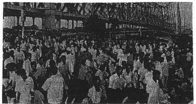
تصویر شماره ۱ شهر کلکته. رشد جمعیت و شتاب شهرنشینی مانع از بوجود آمدن شهرهای سالم است

۱- میزان مرگ و میر کودکان زیر ۵ سال از ۱۹ میلیون نفر در سال ۱۹۶۰ به ۱۱ میلیون نفر در سال ۱۹۹۶ کاهش یافته است.