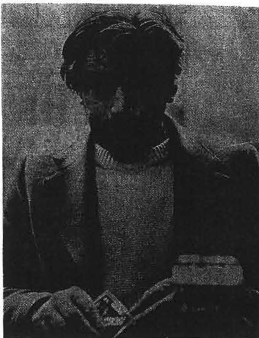
تصویر شماره ۶

مصرف سیگار به تنهایی سبب مرگ و میر ۳ میلیون نفر شده است