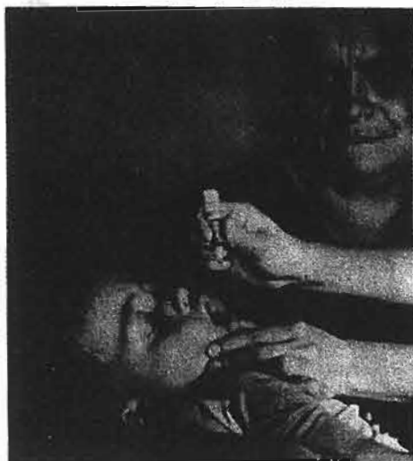
تصویر شماره ۵

بالا ذکر شد می توان اذعان نمود که دست یابی به امر بهداشت برای همه و تأمین سلامتی جسمی، روحی و اجتماعی انسان هر چند امری