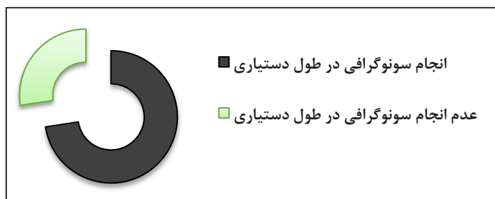
نمودار ۱- انجام سونوگرافی مستقل توسط دستیاران زنان

در پرسشنامه های ارسالی ۱۵۳ نفر از پاسخ دهنده ها در سال سوم دستیاری و ۱۵۷ نفر در سال چهارم دستیاری بوده اند. از مجموع ۳۱۰ پاسخ دهنده، ۲۲۵ نفر بیان داشتند که در طول دوره دستیاری به طور مستقل سونوگرافی انجام داده و ۸۵ نفر به این سوال پاسخ منفی داده اند. حدود ۷۵ درصد دستیاران پاسخ دهنده در طول دوره دستیاری انجام سونوگرافی به طور مستقل را داشته اند