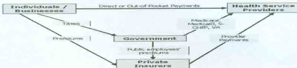
نمودار شماره ۱- سیستم پرداخت امریکا

برخورداری از سلامت، برای همگان یک حق مثبت تلقی می شود و اهمیت حیاتی این مقوله الزامات خاصی را برمی انگیزد که با سایر بخش های خدماتی متفاوت است. پس در عین حال اهداف دیگری همچون پاسخدهی به توقعات و رضایت بیماران، مشارکت عادلانه منابع مالی و توجه به ارتقای مداوم کیفیت ارائه خدمات، نیز باید در کنار کارایی اقتصادی مورد توجه قرار گیرد (۱۵). منظور از تامین منابع مالی بخش سلامت فراهم ساختن وجوه با هدف ایجاد انگیزه برای ارائه دهندگان این نوع خدمات است، به گونه ای که دسترسی اعضای جامعه به مراقبت های بهداشتی درمانی فردی تضمین شود. تقریباً در تمامی کشورهای مورد بررسی، دولت ها به نوعی درگیر تامین بودجه ارائه خدمات بیمه های درمانی هستند. البته در برخی موارد بیمه شدگان مبالغی را خود می پردازند و در برخی موارد بیمه شده، کارفرما و دولت توأماً هزینه را پرداخت می کنند (۱۶).